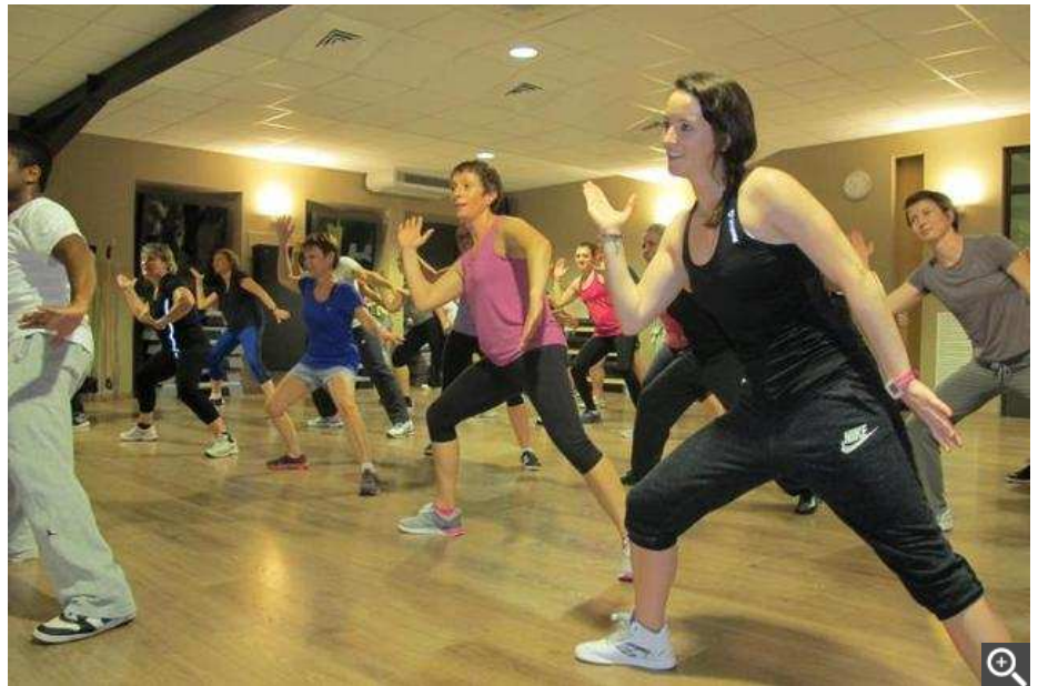
Dans la salle de fitness Les Océades à Niort, les cours de zumba continuent de faire salle comble.

Sur le département, on comptabilise une quarantaine de salles de remises en forme avec de un à trois éducateurs chacune.